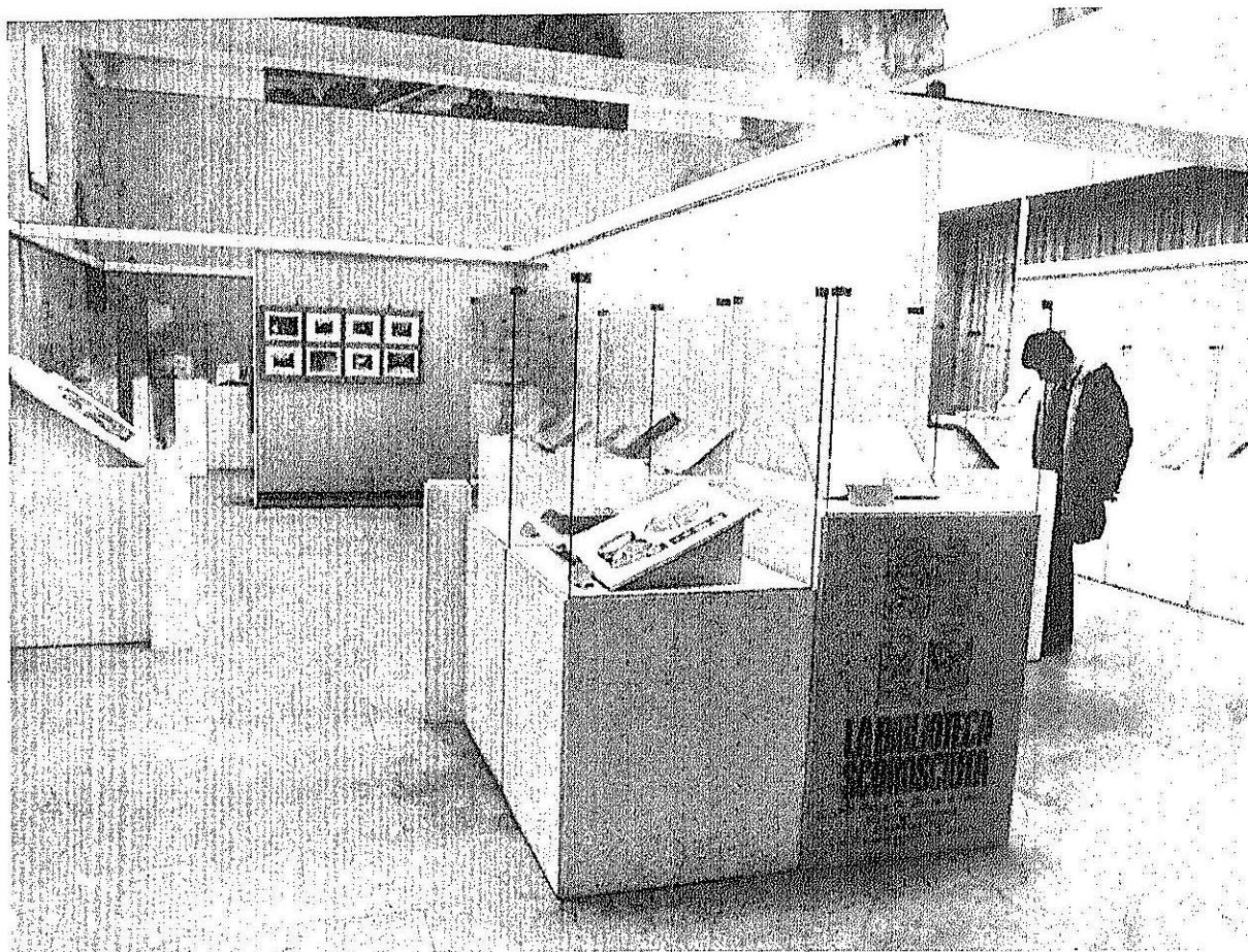
Panoramica della mostra « La Biblioteca sconosciuta ». Faenza, Voltone della Molinella, 20-30 gennaio 1974.